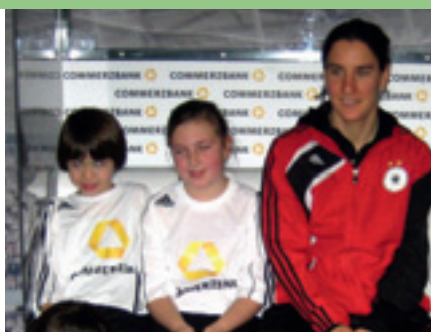
Auf Tuchfühlung mit der Weltmeisterin.

Im Dezember 2010 wurde für Shirin aus dem Bethanien Kinder- und Jugenddorf Eltville-Erbach ein ganz persönlicher Traum wahr. Durch den netten Kontakt des Pädagogischen Fachdienstes zum Deutschen Fußballbund, erhielt Shirin die Möglichkeit, an einem Trainingstag mit der Weltmeisterin und Weltfußballerin Birgit Prinz in Stuttgart teilzunehmen. Einen ganzen Tag Fußballspielen mit ihrem großen Idol – eine tolle Aktion, die Shirin niemals vergessen wird. Neben dem aufregenden Treiben auf und um den Fußballplatz, hatte der DFB noch einen Kameramann geschickt, der seinen Fokus ganz auf Shirin richtete und damit einen kleinen Beitrag zum DFB-TV leistete, der im Frühjahr auf der offiziellen Homepage des DFB zu sehen sein wird. Neben