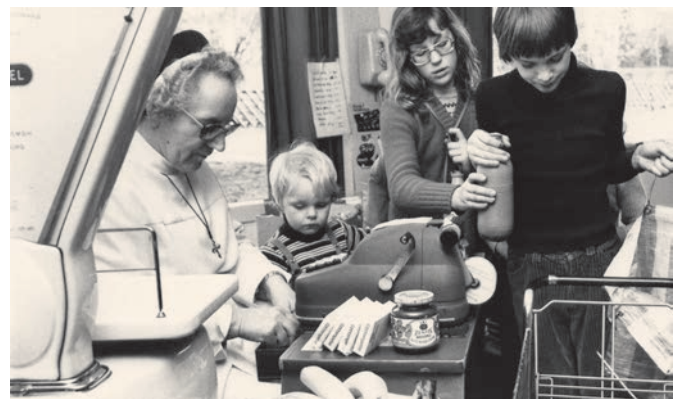
Im Lebensmitteladen des Kinderdorfes wurde mit eigener Währung bezahlt – für die Kinder eine gute Möglichkeit, den Umgang Geld zu lernen.