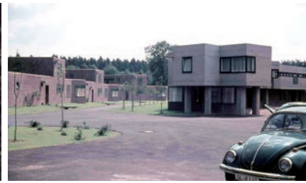
Das noch neue Außengelände.