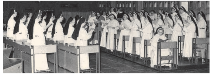
Chorgebet in der Kapelle von Waldniel (heute Schwalmtal).