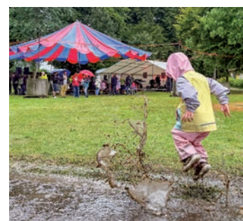
Wenn das Leben dir Regen schenkt, spring in die Pfütze und hab trotzdem Spaß!