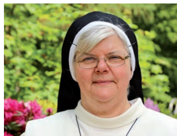
SR. KATHARINA, GENERALPRIORIN DER DOMINIKANERINNEN VON BETHANIEN

Was ich mir als Schwester wünsche, ist das Vertrauen der Mitarbeitenden darin, dass die Gebete und das Wohlwollen aller Schwestern sie tragen und begleiten wollen, sie in unseren Einrichtungen „Bethanien finden“, als einen Ort, an den sie gerne kommen und dort ihr eigenes Menschsein vertiefen, Lebenssinn finden und hoffentlich auch die Liebe Gottes und seine Gegenwart zu entdecken und darin zu wachsen, denn wir sind Gottes Leidenschaft.