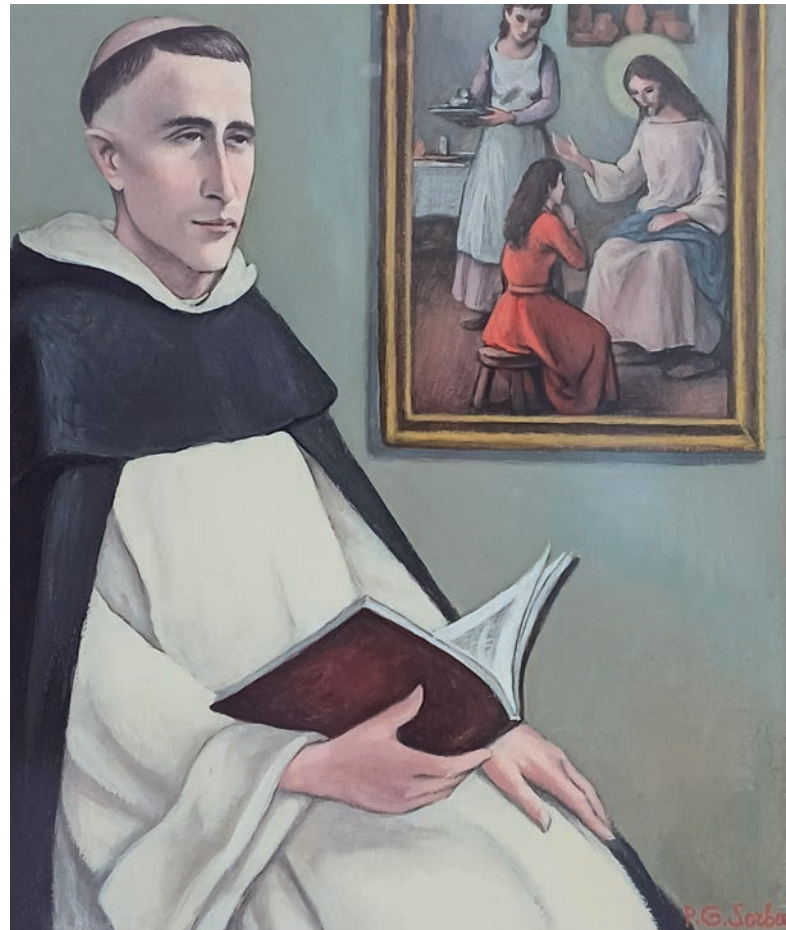
Pater Lataste betrachtet das biblische Bethanien.

Für Pater Lataste war das unerträglich, nicht nur, weil es um ein systemisches gesellschaftliches Unrecht ging, sondern auch aus religiösen Gründen. Die Bibel zeigt uns einen barmherzigen Gott, Jesus wendet sich immer wieder gerade den Sündern zu. Einen Menschen abzustempeln, also dauerhaft abzulehnen, weil er einmal schuldig geworden ist, widerspricht eindeutig dem Willen Jesu.