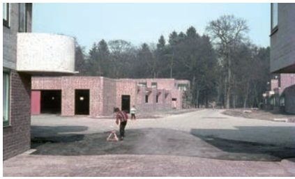
Blick auf das unfertige Außengelände.