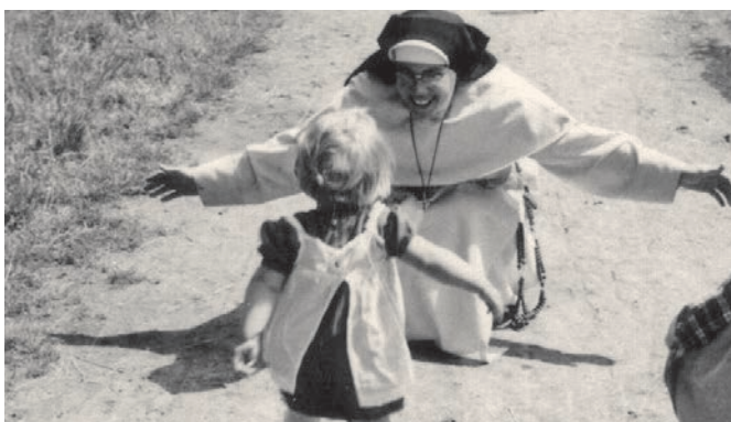
Sonntagsspaziergang in Waldniel, ca. 1958.