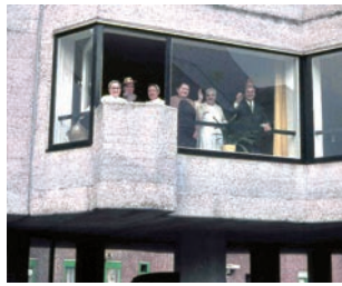
Karneval in der Verwaltung.